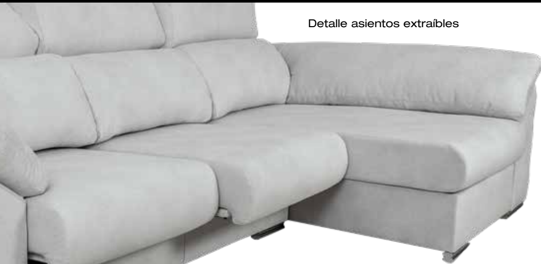
Detalle asientos extraíbles