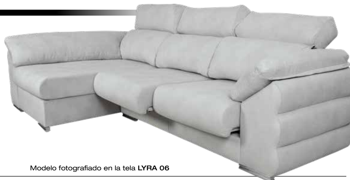
Modelo fotografiado en la tela LYRA 06