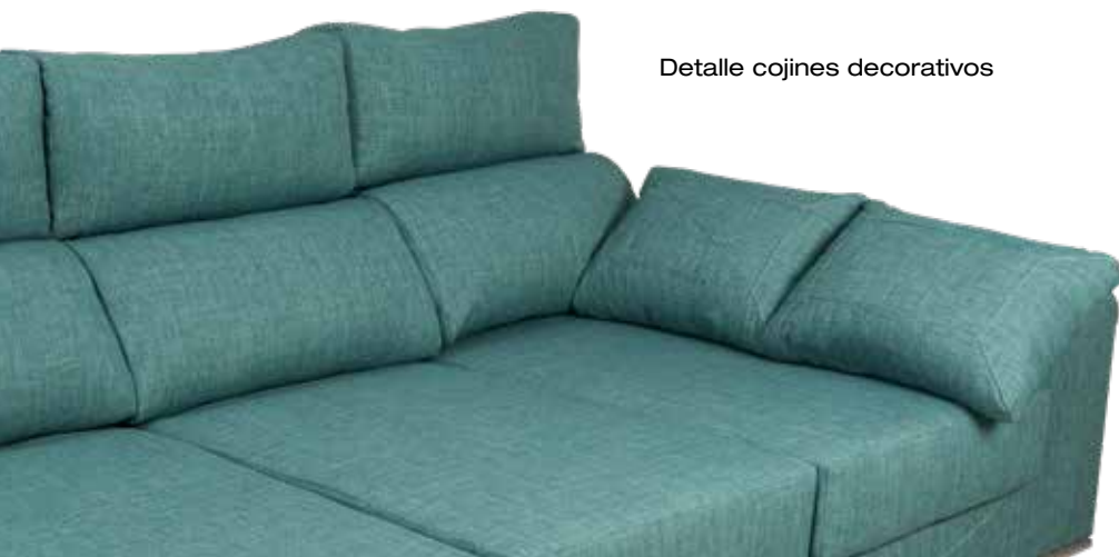
Detalle cojines decorativos