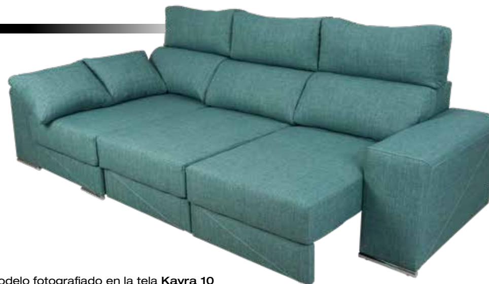
Modelo fotografiado en la tela Kayra 10