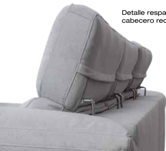
Detalle respaldo cabecero reclinable