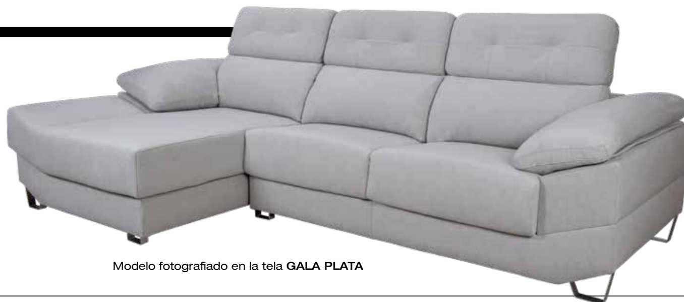
Modelo fotografiado en la tela GALA PLATA