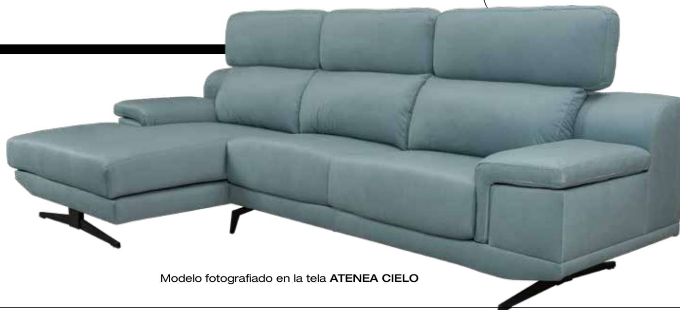
Modelo fotografiado en la tela ATENEA CIELO