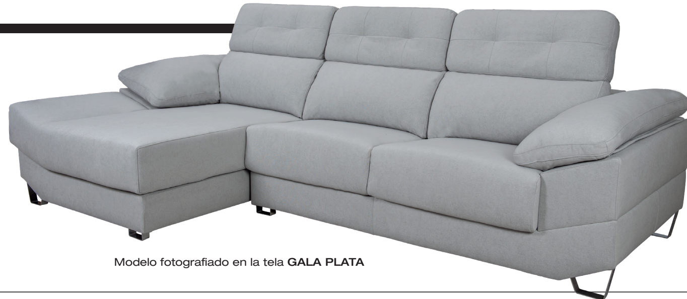
Modelo fotografiado en la tela GALA PLATA