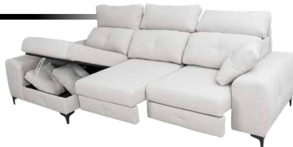
Modelo fotografiado con el tapizado KAIRA 1