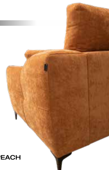
Modelo fotografiado con el tapizado NASERA 7 PEACH