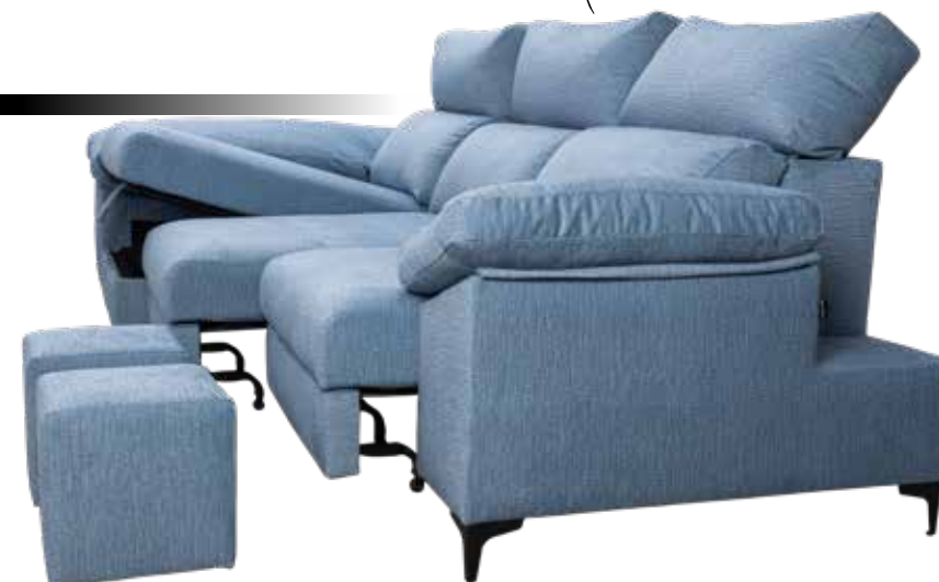
Modelo fotografiado con el tapizado COIMBRA CIELO